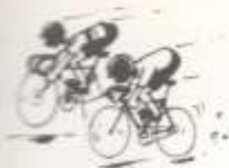
1. cycle racing

Match the sport or game to the appropriate set of rules. Write the number of the sport or game in the correct box. ?