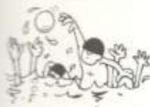
7. water polo