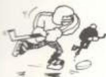
4. ice hockey