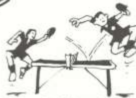
3. table tennis